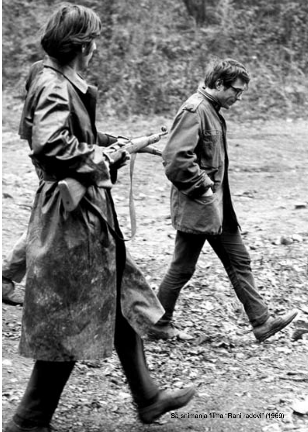
Sa snimanja filma "Rani radovi" (1969)