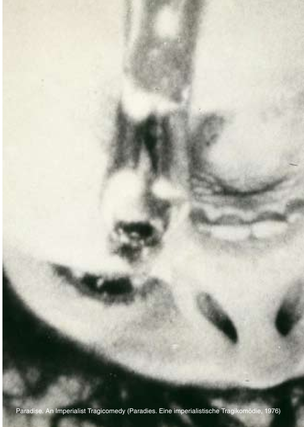
Paradise. An Imperialist Tragicomedy (Paradies. Eine imperialistische Tragikomödie, 1976)