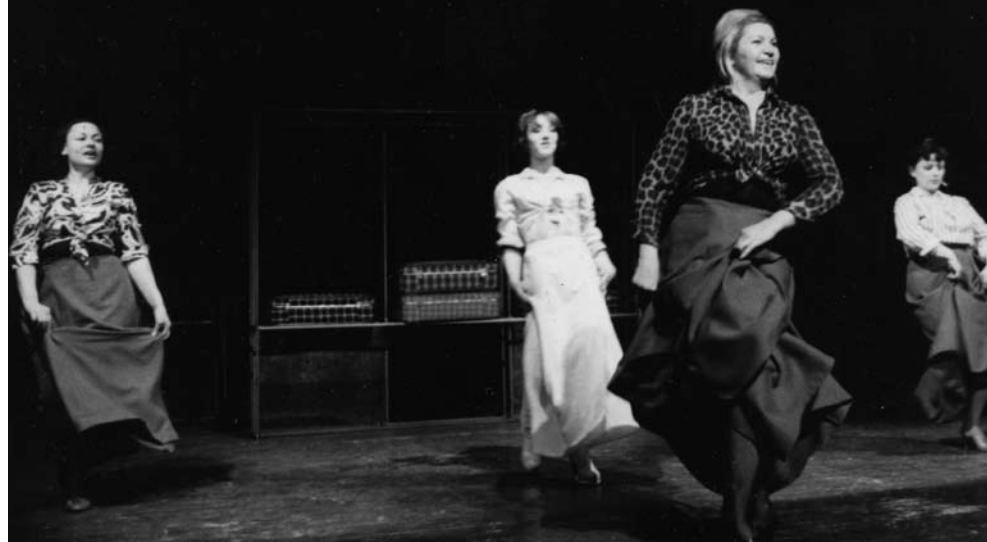
Gastarbajter opera (1977)

Uz kontinuirani rad na filmskoj produkciji, Žilnik se od 1997. godine bavi i pedagoškim radom - mentor je i izvršni producent niza međunarodnih filmskih radionica za studente iz regiona jugoistočne Evrope (npr. «Podeljeni bog / Divided God» tokom 2007/2008, «Petrovaradinsko pleme» 2005, »Crossing Borders» u Krškom tokom leta 2003 - 2008, «Vitae impossibili» u Napulju, 2003, «Dokument + fikcija» u Skoplju 1997 i Zagrebu 1998). Kao gostujući predavač saraduje sa brojnim inostranim filmskim školama (Goldsmiths College – University of London, Leiden University, Kunst Akademie u Beču, Stanford University, Central European University, Budimpešta, School of Arts and Communication - Malmö University, University College London, i dr).